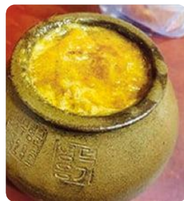
경북 의성 토종꿀