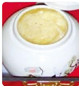
전북 무주 토종꿀